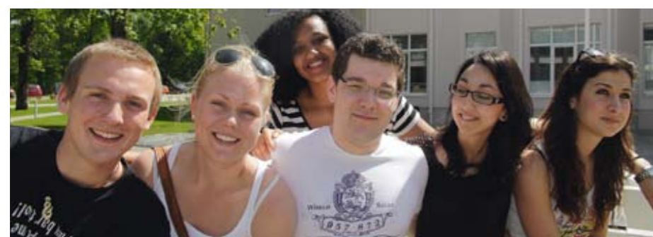
Иностранные студенты в РСУ (2010)

* Европейская система передачи и накопления кредитных пунктов