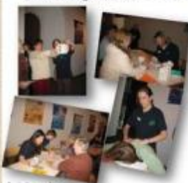
Tālrunis: 29358532

Raunas ielā 4 laikā no plkst. 11 00 – 16 00