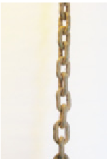
Korozijas rezultātā metāla virsma nav gluda