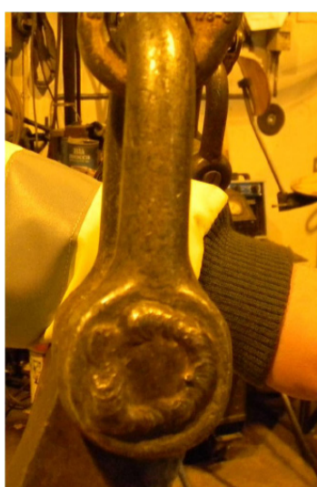
Metināta šuve. Celšanas komponentu metināšana nav atļauta !