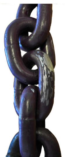
Lokāls izdilums pārsniedz 10%