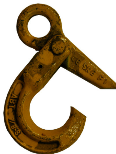
Bojāts āķa aizslēgs, vai tā nav vispār.