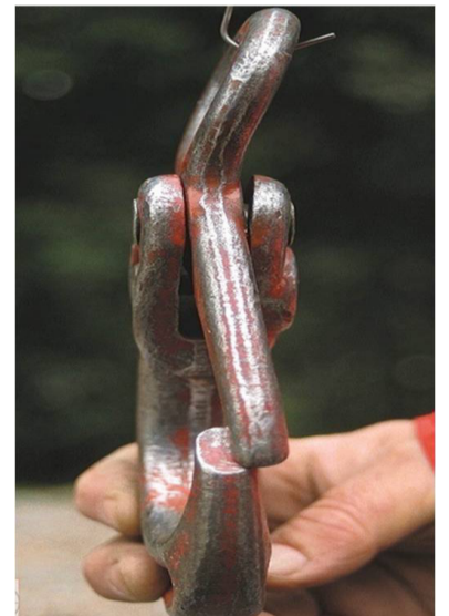
Nepareizas stropēšanas izraisīta deformācija