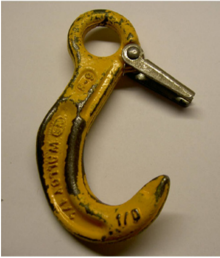
Pārslodze, izliekumi, deformācija

Vizuāli pārbaudiet stropes pirms katras lietošanas reizes ! Nelietojiet stropes, ja konstatējat sekojošo: