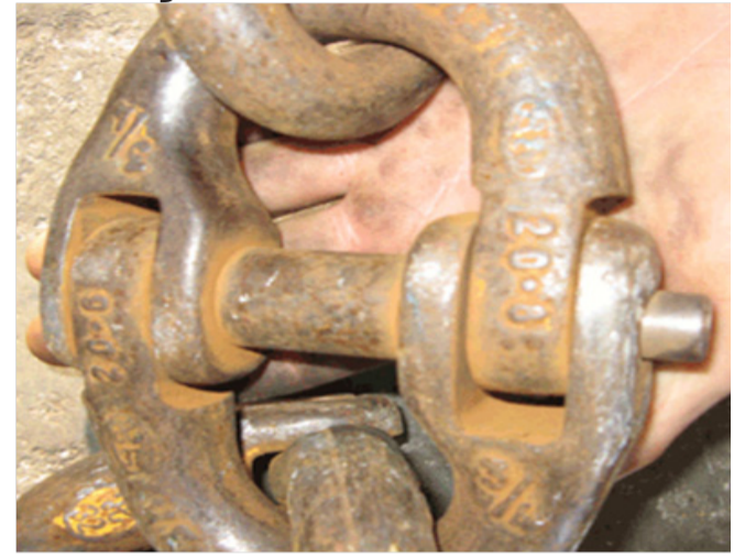
Savienojuma pirksts neturas vietā (nolietojums)