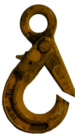
Āķa aizslēgs nenotur āķi aizvērtu