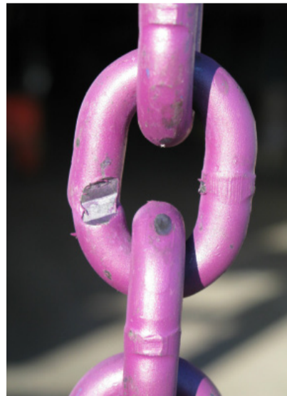
Iegriezumi, robi, izdrupumi, plaisas