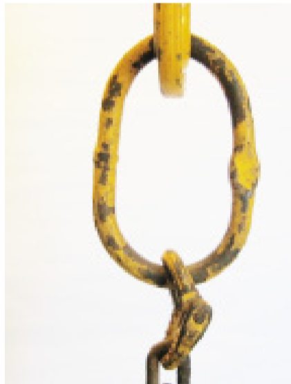
Pārslodzes izraisīta gredzena deformācija