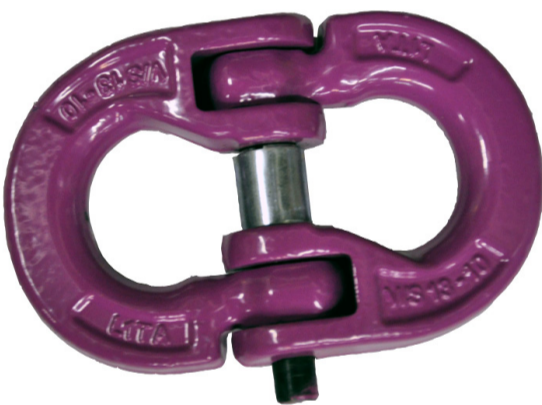
Savienojuma pirksts neturas vietā (bojāts sprostgredzens)