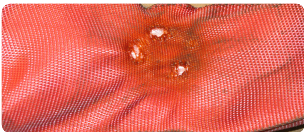
Karstuma radīts sakausējums