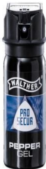
Piparu gēla baloniņš