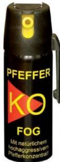
Piparu gāzes baloniņš