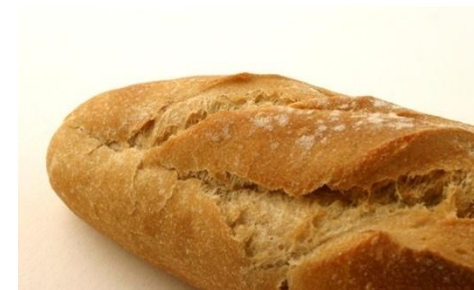
Maizes cepšanas process