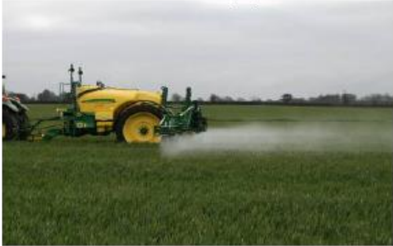
Boom Height 0.8m