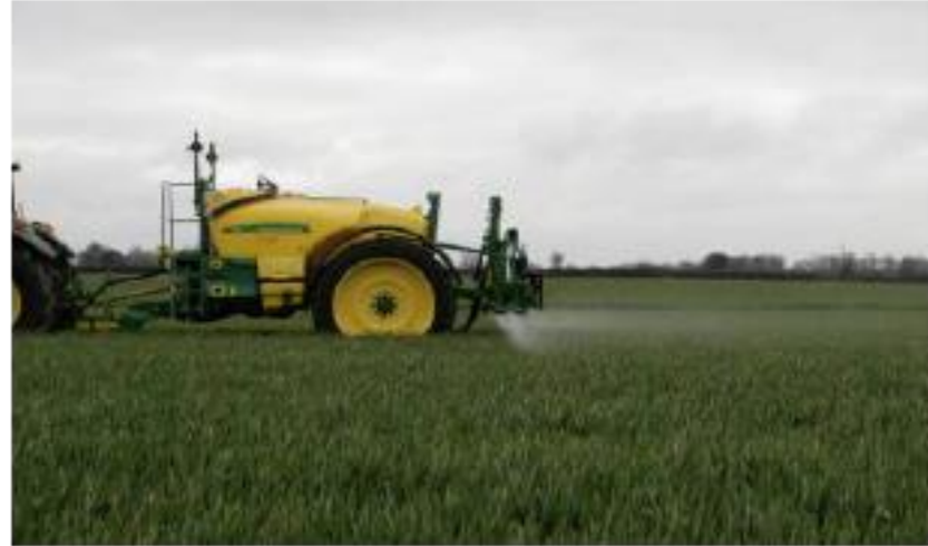
Boom Height 0.5m