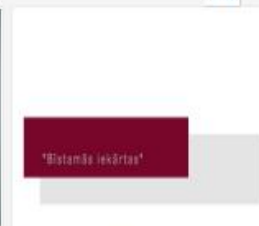
315_2016_Bistamas...mp4 701 MB