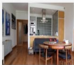
318_2016_Pedejije_v...mp4 391 MB