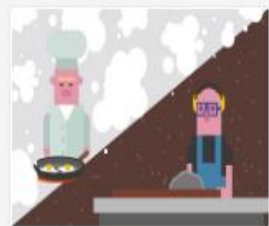
321_2016_Videopado...mov 70 MB