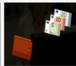
006_278_2015_Darba...mp4 497 MB