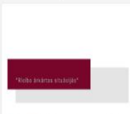
314_2016_Riciba_ar...mp4 696 MB