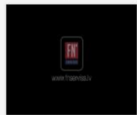
309_2016_Riski_pav...mp4 1.5 GB