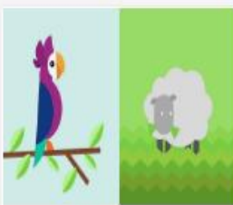
320_2106_Videopado...mov 70 MB