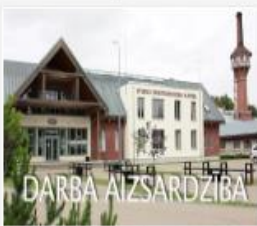
308_2016_DA_veseli...mp4 1.4 GB