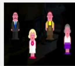
007_279_2015_Runa...mp4 455 MB