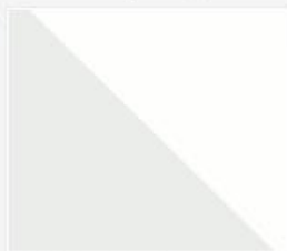
009_282_2015_Darba...mp4 83 MB