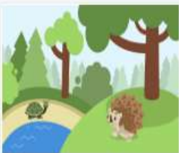
319_2016_Videopado...mov 59 MB